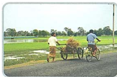
วิถีชีวิตเรียบง่ายของชาวเมืองมหาสารคาม

แผนที่จังหวัดมหาสารคาม และแหล่งท่องเที่ยวที่สำคัญ