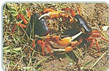
ปูทะเลกระหม่อม